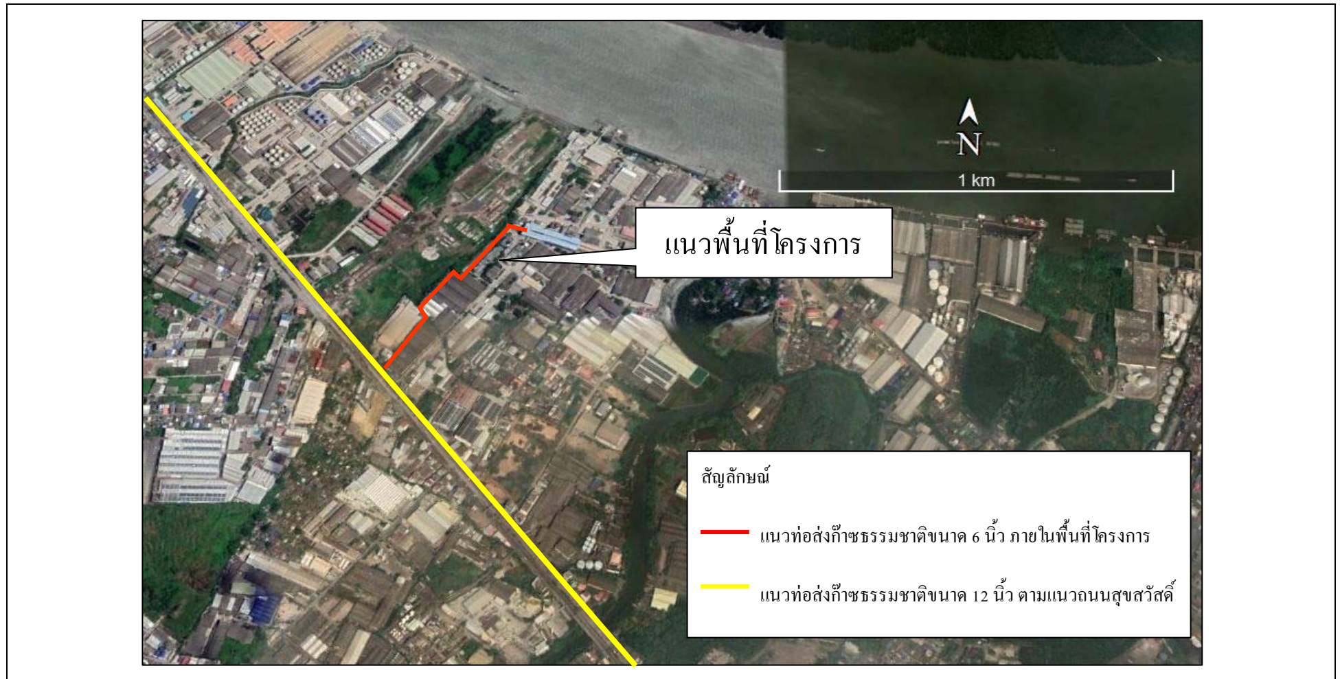
รูปที่ 2.1-1 ที่ตั้งโครงการ